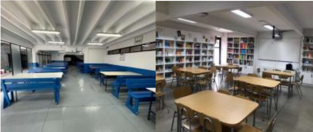
COMEDOR ESTUDIANTES BIBLIOTECA CRA ANEXO AL PLAN DE SEGURIDAD COLEGIO ALBORADA DEL MAR

cuidado. En este lugar, se evaluará su derivación al servicio de salud comunal de ser necesario: